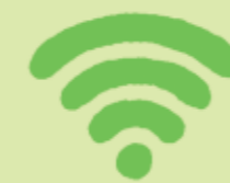
Fri wifi ingår i biljetten.

Mer kommer framöver. Tanken är att linje 55 ska bli först med att testa ny teknik och nya idéer innan de genomförs i större skala.