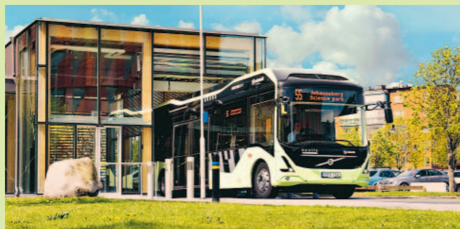
Den första inomhushållplatsen ligger på Lindholmen.

55:ans inomhushållplats ligger vid Lindholmen Science Park. Här kommer bussen att ladda batterierna.