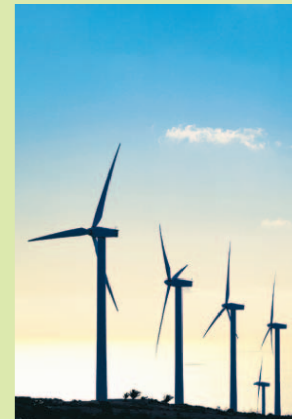
Elbussen går på vind och vatten.

Nästa vecka är det dags för den första turen med 55:an, den nya elbussen mellan Chalmers och Lindholmen.